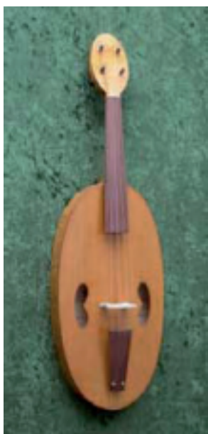
FÍDULES CONSTRUCCIÓ MODERNA (A partir del s. X-XIII)