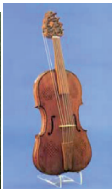
LIRA DA BRACCIO Finals s. XV-XVI